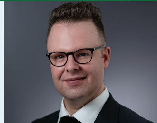
Carl Bouchard Commissaire aux services en français par intérim